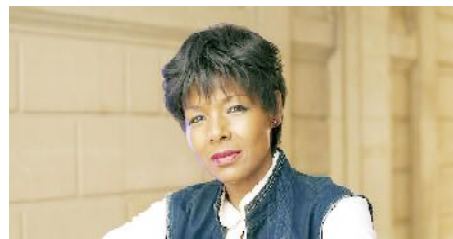
Médicis étranger en 1980.

" Une saison blanche et sèche " (titre original en anglais: ADY White Season ) est le quatrième roman d'André Brink, publié en 1979. Interdit de publication en Afrique du Sud, il est originellement publié à Londres chez l'éditeur WHAllen, puis traduit dans une dizaine de langues. La traduction française paraît en janvier 1980 aux éditions Stock. Il reçoit le Prix