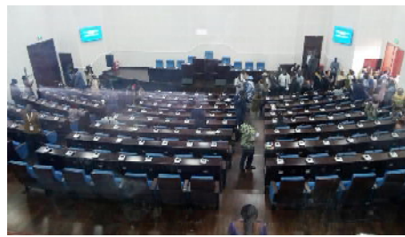
Salle des plénières

Quant à la salle des plénières de 266 places, elle se situe au centre du bâtiment, dont 153 pour les parlementaires qui auront désormais, chacun, un bureau dans l'édifice, toute chose qui changeant des conditions austères dans lesquelles ils exerçaient jusqu'à présent. Il faut aussi noter les deux salles de réunions de 90 et 50 places, les 10 salles de réunions et les bureaux du personnel d'appui permanent. Il n'en fallait pas plus pour flatter l'égo de Jean Kissi, député du Comité d'Action pour le Renouveau (CAR) qu'il était temps que les représentants du peuple aient un cadre digne de leur statut et qui leur permette de mieux servir les intérêts des populations. Le Président de l'Assemblée Nationale a donc appelé ses collègues à privilégier l'efficacité, la célérité, la sérénité et la qualité doublée de la rigueur dans