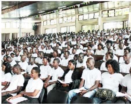
Des jeunes du PROVONAT

Le gouvernement, lui, continue de se débattre au point où des critiques légitimes sont faites aux différentes initiatives : la politique nationale de l'emploi et un plan stratégique national pour l'emploi des jeunes, adoptés en 2014 avec l'ambition de contribuer à réduire le chômage et le sous-emploi des