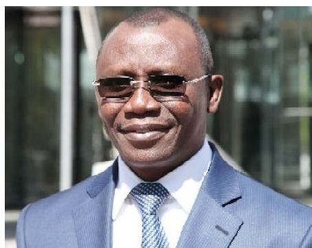
Sani Yaya, Ministre de l'Economie et des Finances

«Il est important que la politique fiscale se poursuive en mettant l'accent sur la réduction de la dette publique et préserver une fiscalité durable. Les autorités doivent poursuivre les réformes afin de redresser le faible niveau de collecte des revenus, de prévenir de nouveaux arriérés, améliorer l'effectivité du coût des projets d'investissement public,