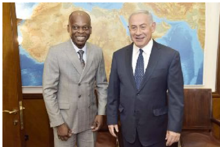
Robert Dussey et le Premier ministre israélien, Benjamin Netanyahu

Sur les questions d'ordre bilatéral, Robert Dussey et le Premier ministre israélien, Benjamin Netanyahu se sont félicités du dynamisme de la coopération entre leurs deux pays et ont passé en revue les grandes réalisations issues des décisions de la première grande commission mixte de coopération. A cet égard, souligne le communiqué, ils se sont réjouis des actions concrètes et fructueuses de l'Agence israélienne pour la coopération internationale au développement (MASHAV) dans le processus de développement du Togo, en particulier dans les secteurs de la santé et de l'agriculture et ont convenu de la poursuite de ces efforts. Ils ont également relevé la nécessité de relancer les travaux de la deuxième grande commission mixte de coopération entre les deux pays et de soutenir les actions des deux gouverne-