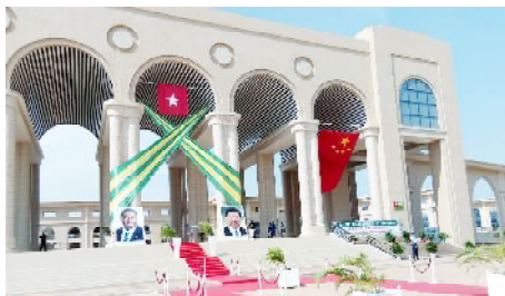
Vue de face de l'immeuble

Le chemin fut long. Du premier siège de l'Assemblée nationale situé en bordure de mer, construit dans les années 60 et très vite abandonné suite aux événements politiques du pays, au nouveau fraîchement inauguré ce 14 Juin 2018, l'attente a