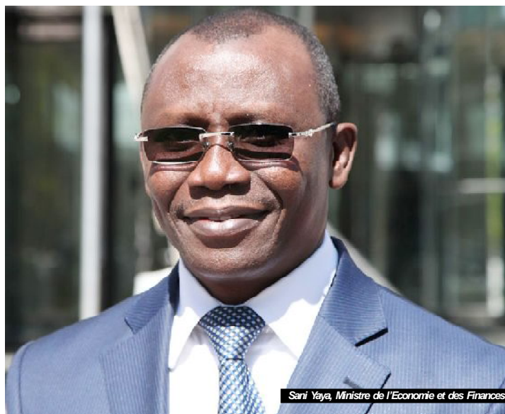
Sani Yaya, Ministre de l'Economie et des Finances

P3 En lien avec les innombrables initiatives en faveur des jeunes Les emplois décents à créer et les taux à réduire en 2018-2022